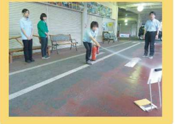
○防火訓練のようす