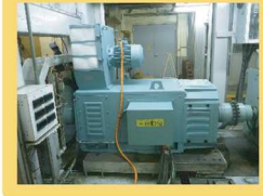
○主原動機OHのようす